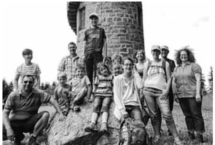
Rückblick Familienwanderung: Beim Brendturm