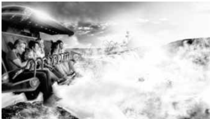
Im Voletarium konnte die Natur und die Größe des Parks bestaunt werden

Sehr früh aufstehen und das in den Ferien??? Genau das war am 18. August der Fall. Pünktlich um 7:00 Uhr standen die Jugendlichen zur Abfahrt am Jugendtreff in Dotternhausen bereit. Mit zwei Bussen ging es auf zum Europapark. Während der Fahrt fand ein reger Austausch statt, welche die beste Achterbahn ist und was es für neue Attraktionen gibt. Dort angekommen liefen die Jugendlichen in Kleingruppen durch die verschiedenen Länderthemen und konnten unterschiedliche Fahrgeschäfte besuchen. Auch die neuste Attraktion, das „Voletarium“, konnte ausprobiert werden. Die Jugendlichen konnten mit hoher Geschwindigkeit in einer Kuppel durch verschiedene Landschaften fliegen. Aufgrund der Sommerferien war der Ansturm auf den Themenpark sehr hoch und oftmals