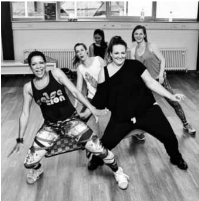
Move and Shine

Sichern Sie sich vorab ihre Eintrittskarte bei der Bäckerei Milles .