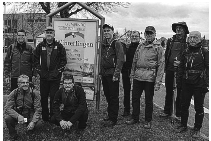
Die Extrem-Wanderer vor dem Start in Winterlingen