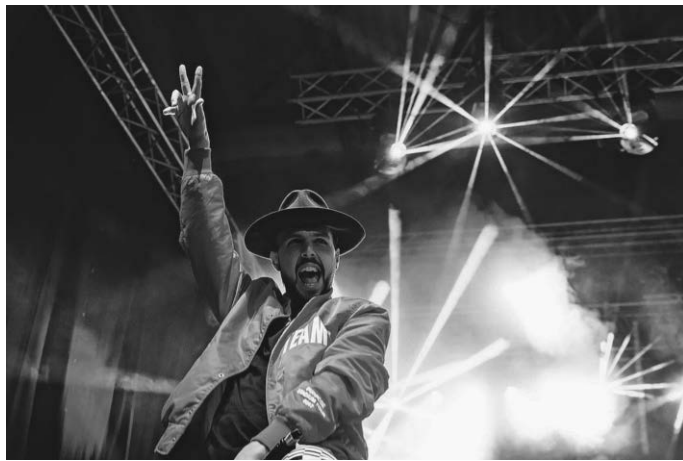
Twelve24 (Bildrechte: Görner)