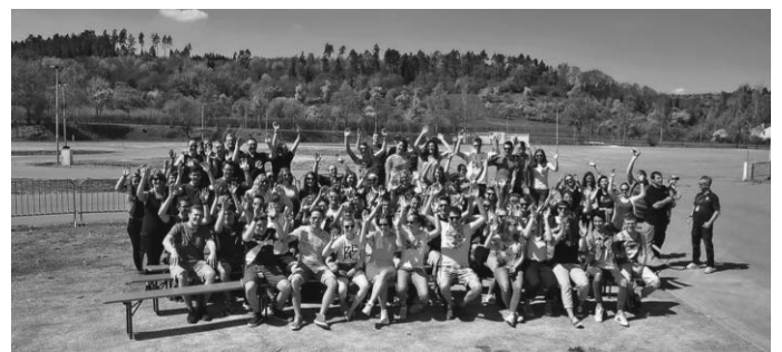
Teil der BRF-Mitarbeiter

Weitere Bilder und Infos unter www.balingen-rockfestival.de