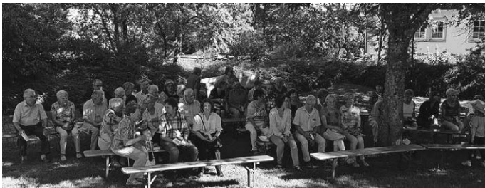
Viele Gläubige belegten die bereitgestellten Bänke, die zum Gottesdienst Beginn alle voll besetzt waren.