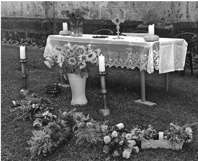
Mitgebrachte Kräuter wurden gesegnet