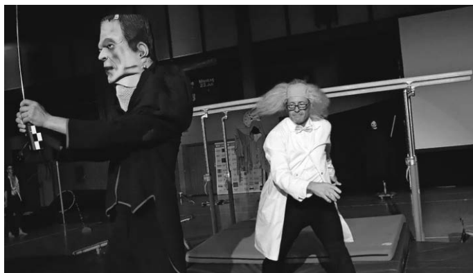
Zombies, Frankenstein und ein Professor treiben ihr Unwesen am Barren