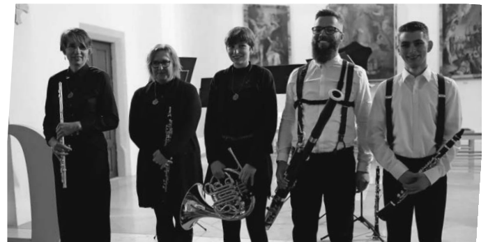
Die fünf Musikerinnen und Musiker von LaQuintessenza