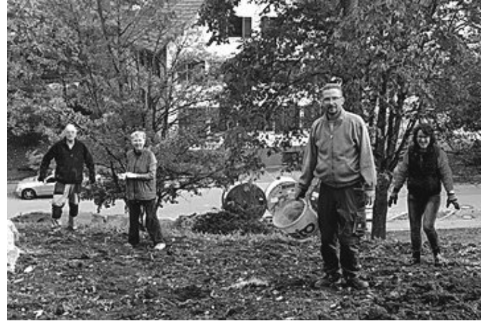
Fleißige Helfer und Helferinnen

Wie bereits an dieser Stelle erwähnt, werden wir bestimmte Arbeiten in Eigenleistung durchführen. So stand kürzlich auf dem Plan: Äste, Wurzeln und Steine aus dem verteilten Mutterboden auszusortieren. Denn bevor dieser gefräst wird, sollte dieser von Unrat befreit sein. Fleißige Helfer und Helferinnen hatten sich bereit erklärt diese Arbeiten zu übernehmen.