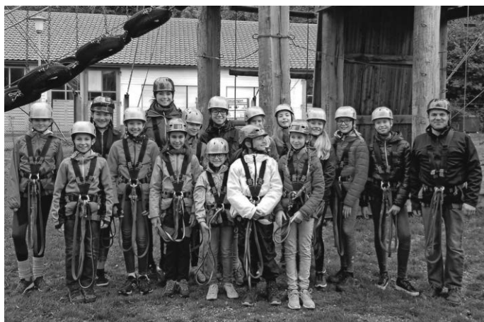
Auf zum Klettern

Hoch hinauf ging es für unsere Junioren im Kletterpark Sigmaringen. Nach einer ausführlichen Einweisung bekamen alle ihre Sicherheitsausrüstung und es ging direkt in den Parcours. Der Hochseilgarten ist bis zu 10 Meter hoch und hat 33 Herausforderungen. Es ging über Balken, Baumstämme, Tauen oder über Autoreifen. Man musste balancieren und schwingende Seilkonstruktionen überwinden. Alle benötigten eine große Portion Mut und Körperbeherrschung. Der absolute Höhepunkt war der Giant Swing, eine 10-Meter Riesenschaukel. Dabei wurden Geschwindigkeiten bis 70 km/h erreicht. Einer nach dem anderen wurde mit seiner Sicherheitsausrüstung in eine Schaukel eingehängt und alle anderen mussten als Team den/die Kandidaten über ein Flaschenzugsystem auf eine Höhe von 10 Metern hochziehen. Über eine Reißleine musste jeder die Schaukel selbst auslösen. Ein paar Mutige ließen sich sogar über Kopf fallen.