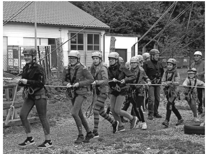
Gemeinsames Ziehen für den Giant Swing

Daher bitten wir um eine Anmeldung bis 30.10. unter vorstand@narrenzunft-dotternhausen.de oder bei Sonja 0160/97018719. Das Team der Narrenzunft freut sich auf weitere Zusagen.