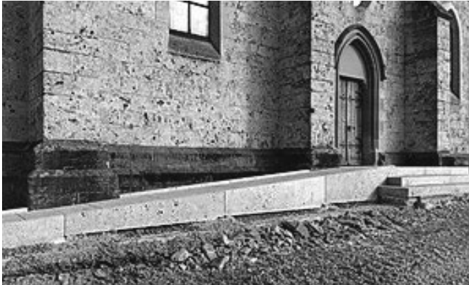
Rampe aus Travertin für den barrierefreien Zugang zur Kirche

Der Travertin kommt somit aus deutschen Landen und hat auch einen stolzen Preis. Bei einem vor Ort Termin des Kirchengemeinderates mit Architekt und Steinmetz wurde die Kostensituation nochmals erläutert. Nach längerer Diskussion und Erläuterung des Architekten, warum hier eine Kostensteigerung vorliegt, beschloss der Kirchengemeinderat, die Rampe am Seiteneingang mit dem vom Denkmalamt favorisierten heimischen Stein „Travertin“ zu erstellen. Zwischenzeitlich wurde die Rampe angebracht und fügt sich gut in die Gemäuer ein.