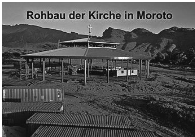
Rohbau der Kirche in Moroto

Handy: 0151 111 280 93, E-Mail: pfaff.franz@outlook.de