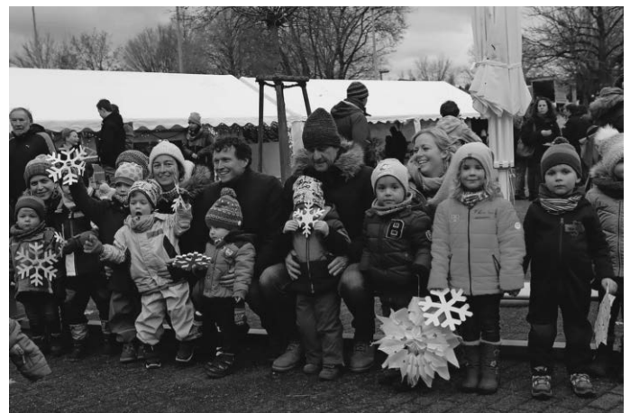
Das Eltern Kind Turnen trug wiederum zum Unterhaltungsprogramm bei.