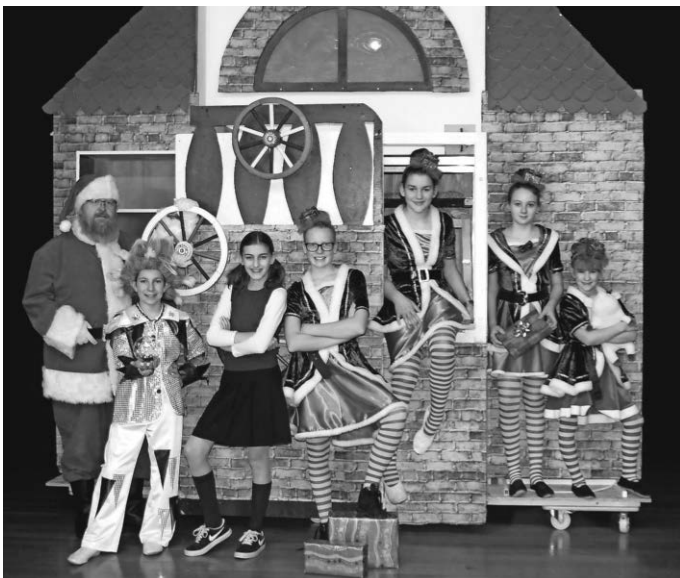
Unsere Hauptakteure freuen sich auf Samstag