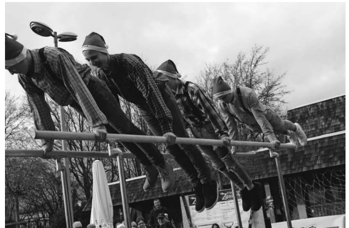
Die „Zipfelmützen“ am Barren sorgten für einen turnerischen Leckerbissen.