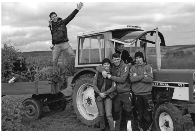
Der Spaß kam definitiv nicht zu kurz