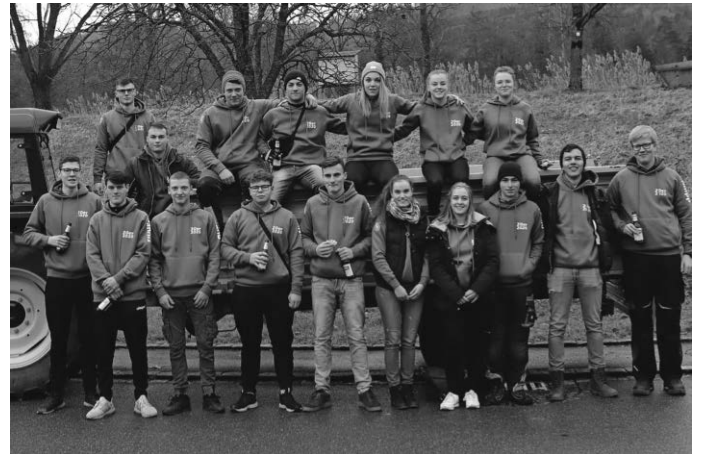
Gruppenbild der gesamten Truppe