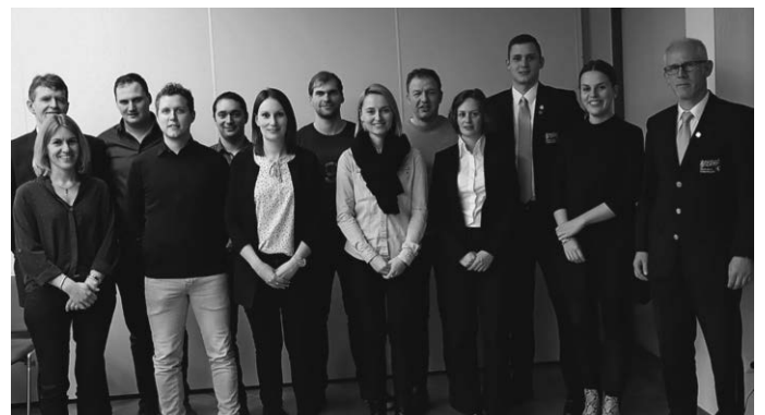
Die Vorstandschaft 2020