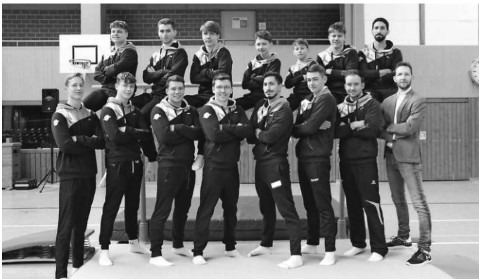
Das erfolgreiche SVD Turn-Team

Nächster und letzter Vorrunden-Wettkampf ist am kommenden Samstag, 12. März um 15.00 Uhr auswärts gegen den TV Beffendorf. Auch dieses Duell möchte der SVD gerne für sich entscheiden, um die Meisterschaft klar zu machen und sich damit für den Aufstiegswettkampf zur Bezirksligarelegation am 30. April in Wernau zu qualifizieren.