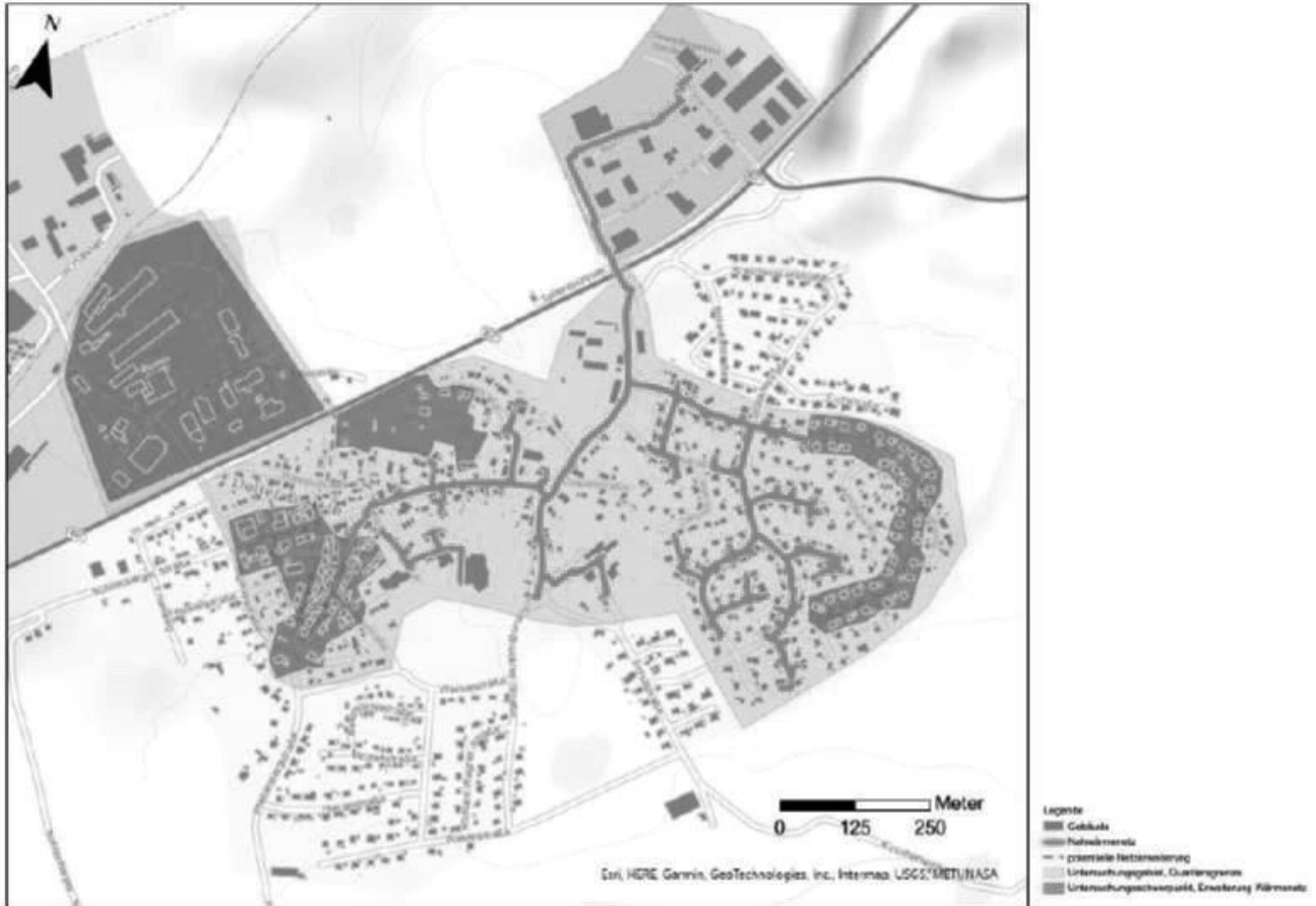
Abbildung 1: Lageplan und Abgrenzung des Quartiers „Dotternhausen Mitte“

das Ingenieurbüro RBSwave GmbH erstellt für die Gemeinde Dotternhausen derzeit ein integriertes energetisches Quartierskonzept für das Quartier „Dotternhausen Mitte“. Die Quartiersgrenze orientiert sich hierbei im Wesentlichen am Einzugsgebiet des vorhandenen Fernwärmenetzes inkl. potenzieller Erweiterungsgebiete.