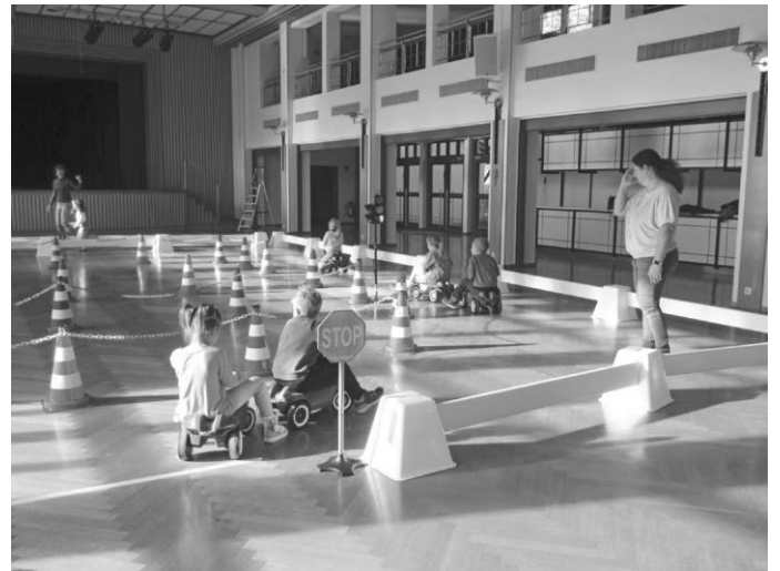
Ein Vormittag mit der Verkehrswacht in Dotternhausen

Es hat allen großen Spaß gemacht, und wir haben viel über Sicherheit im Straßenverkehr gelernt. Jetzt wissen wir, wie man sich richtig verhält – egal ob als Fußgänger oder als Fahrer eines Fahrzeuges!