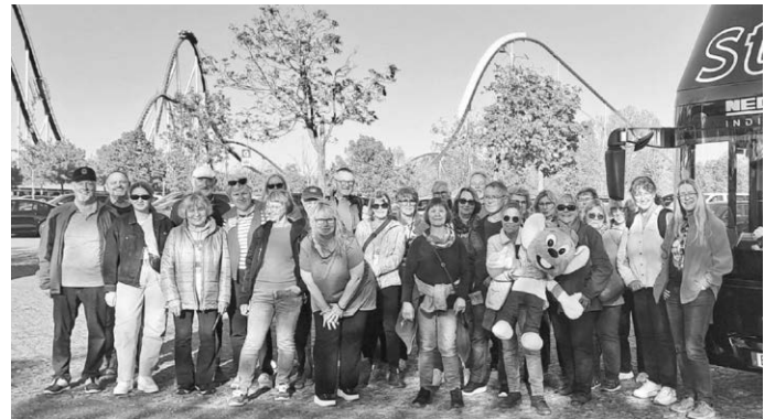
Das Bild zeigt die Teilnehmer vor dem Europapark

Europapark die Zusage für die Aktion „Frohe Herzen“ bekam. So ging es dann vor kurzem mit dem vollbesetzten Bus auf den Weg nach Rust. Der Wettergott hatte es mit den VdK-lern und den weiteren Teilnehmern sehr gut gemeint. Es herrschte sehr schönes Frühlingswetter. Nach einer gemütlichen Fahrt über die Autobahn und das Kinzigtal erreichten die Ausflügler frohgelaut den Europapark. Dort gab es wieder viele Attraktionen zu bestaunen. Bei den Fahrten mit verschiedenen Parkbahnen konnte man sich einen Überblick über das riesige Angebot des Parks verschaffen. Themenangebote zu den einzelnen europäischen Ländern zeigten typische Gegebenheiten dieser Länder und die angebotenen Attraktionen waren sehr gefragt und unterhaltsam. So konnte im Europapark jeder dann seine eigenen Wege gehen und alles erkunden, sei es mit einer waghalsigen Achterbahn oder auch einer gemütlichen Rundfahrt durch den Park. Eine Fahrt mit dem Kettenkarussell erinnerte noch an vergangene Kindertage. Alle waren sich einig einen schönen Tag erlebt zu haben und frohgelaut wurde die Heimreise wieder angetreten.